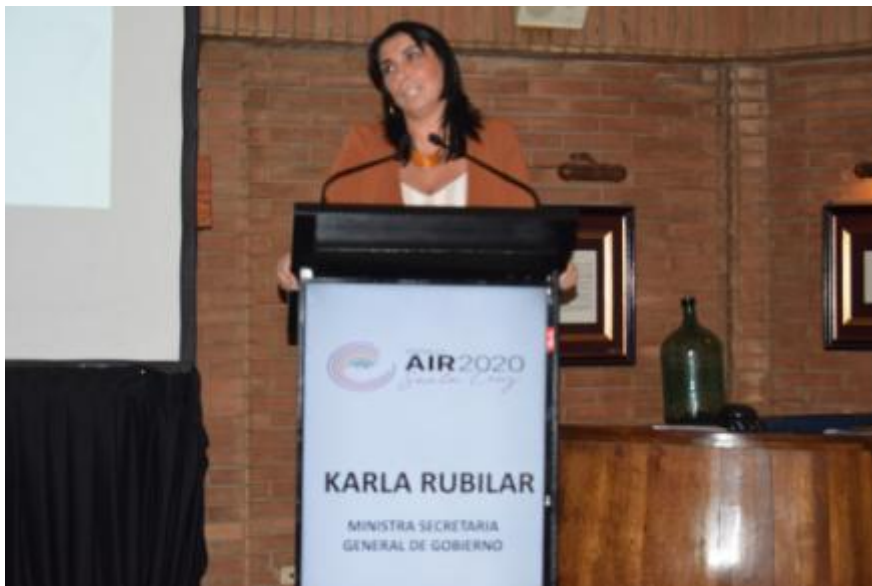
Ministra Secretaria General del Gobierno de Chile Karla Rubilar

“En el Gobierno del Presidente Piñera creemos en una prensa libre y valoramos enormemente el trabajo que hacen la AIR y la ARCHI en defensa de la Libertad de Expresión. No hay democracia si la prensa no puede contar lo que ocurre” , sentenció la Ministra.